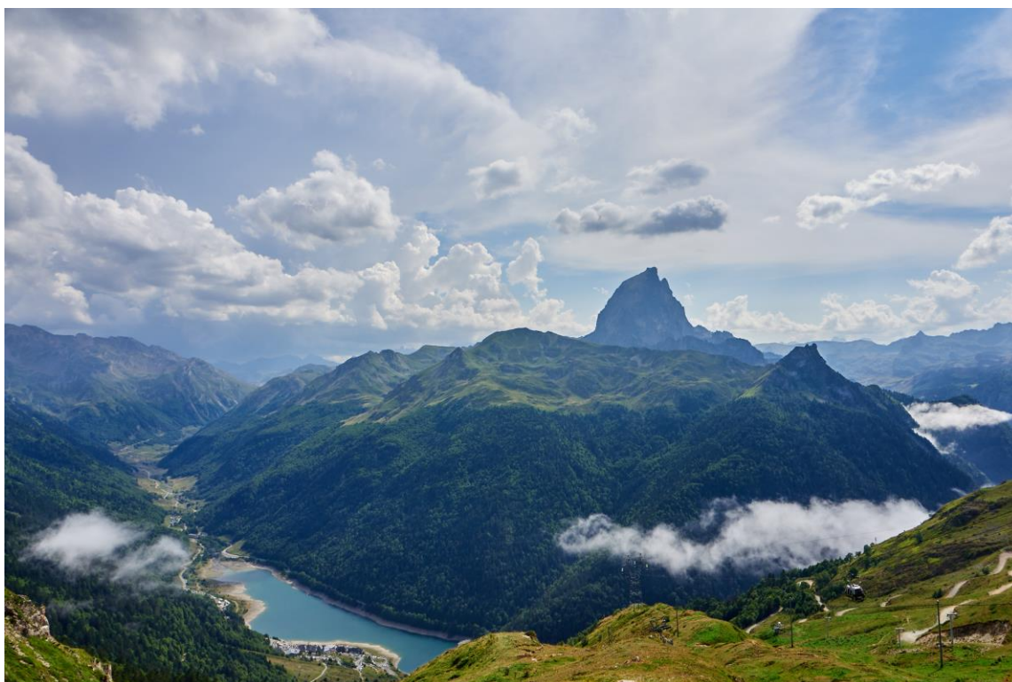
Vue du col de la Sagette sur le vallon du Brousset et le Pic de Midi d'Ossau

Association Béarn Pont de Camps 98, pl de l'Europe 64260 SEVIGNACQ-MEYRACQ Tél : 05.59.84.19.54