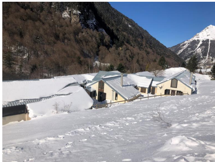
Pont de Camps hiver 2023

Le centre est inscrit au répertoire départemental de la DSDEN, et est déclarée sous le numéro 643201002 auprès du SDJES et dispose du label tourisme et handicap. Le centre est agréé Jeunesse Education Populaire.