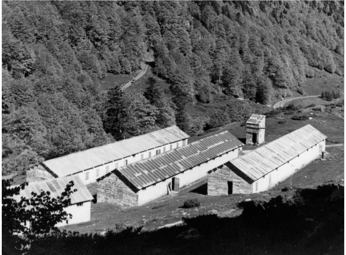
Photo des hébergements de Pont de Camps dans les années 70

construit pour l'occasion. Depuis 1972, il appartient à l'association Béarn Pont de Camps.